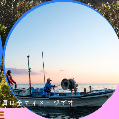
*写真は全てイメージです