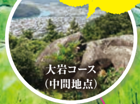
大岩コース (中間地点)