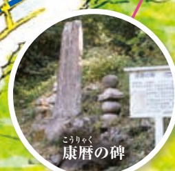
こりやく 康暦の碑

南海地震に関する日本最古の碑。康安元年(1361)の地震津波(正平の南海地震)の被災者の供養碑と伝えられている。