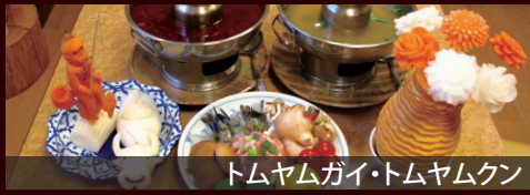
トムヤムガイ・トムヤムクン