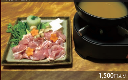
かしわ鍋 (鮭処 道楽)