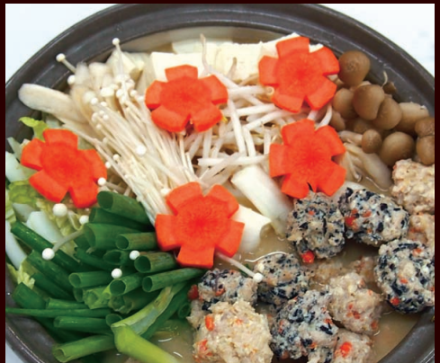
海陽チョウ!元気鍋