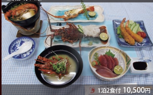
伊勢海老鍋 (民宿 竹ヶ島)