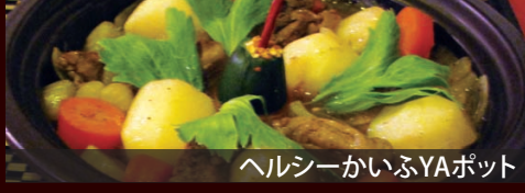
ヘルシーかいふYAポット