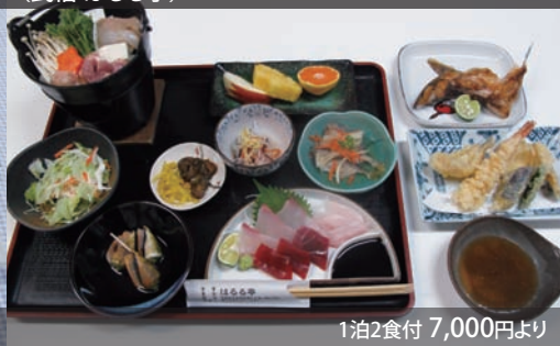
よせ鍋 (民宿 はるる亭)