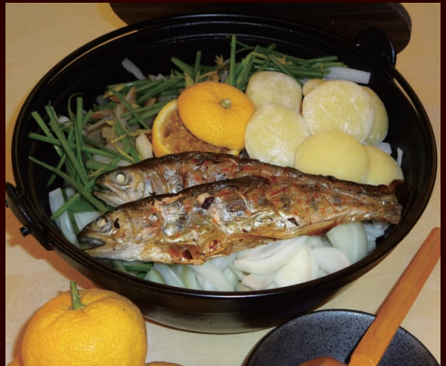
あめご鍋木頭ゆず風味