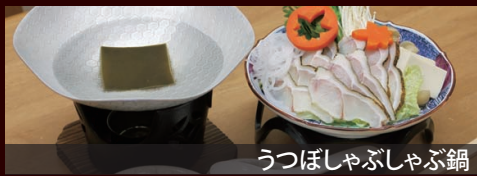
うつぼしゃぶしゃぶ鍋