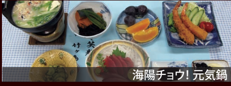
海陽チョウ! 元気鍋