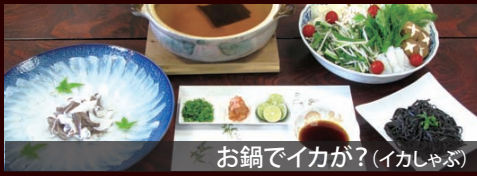
お鍋でイカが?(イカしゃぶ)