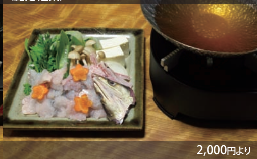
ハモ鍋 (鮭処 道楽)