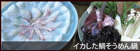
イカした鯛そうめん鍋