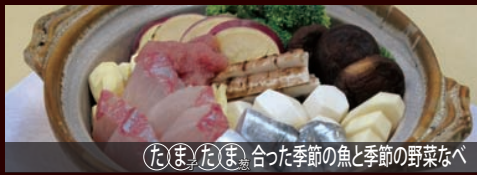
たまたま 合った季節の魚と季節の野菜なべ